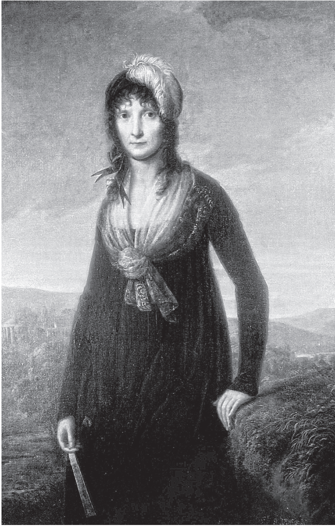
Napoleons Mutter Letizia Bonaparte im Jahr 1800, von Jean- Baptiste Greuze. Sie erzog ihn streng, und später würde er sagen, dass er ihr alles ver- danke.

Luciano, de facto das Oberhaupt der Familie, hatte offenbar noch andere Lehrer gefunden, da Napoleone schon in jungen Jahren von Mathematik geradezu besessen war. 20